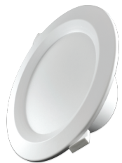
LED Downlight 18W | Ø190mm DW-22