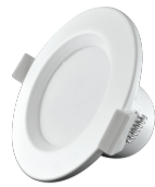
LED Downlight 9W | Ø100mm DW-19