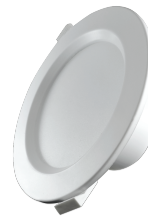
LED Downlight 12W | Ø145mm DW-21