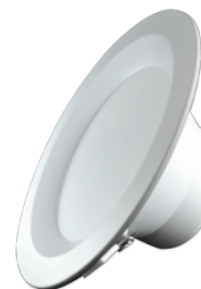
LED Downlight 24W | Ø220mm DW-23